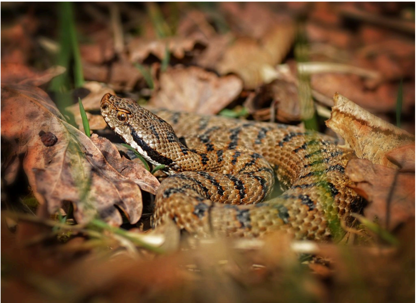
Vipera aspis