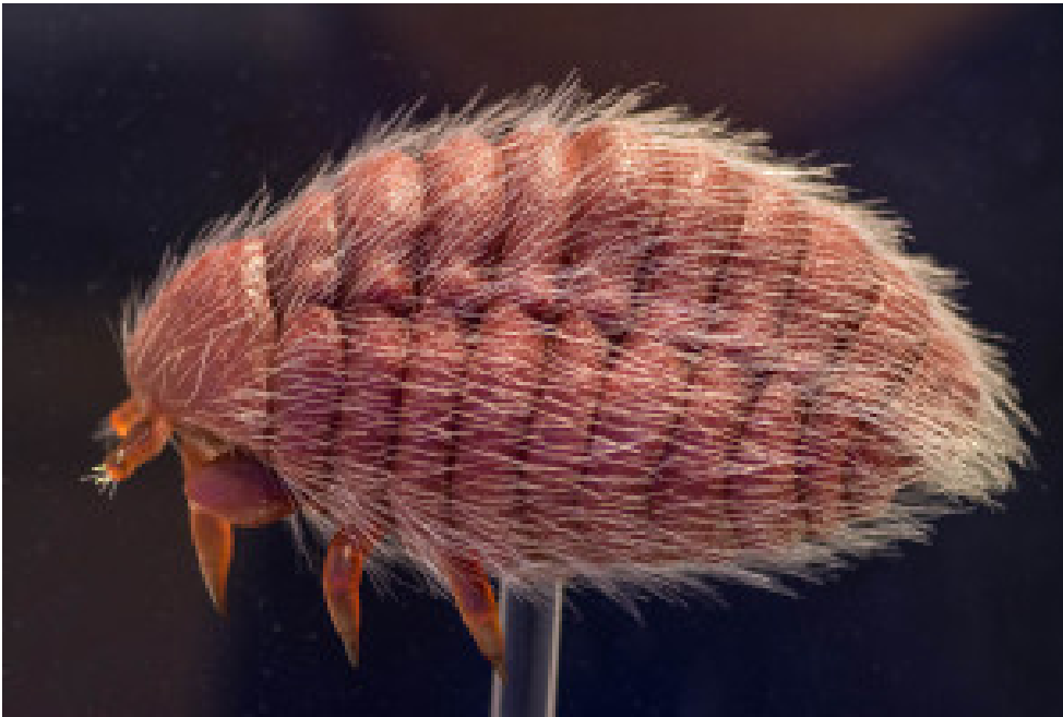
Dactylopius coccus

galle delle radici, sulle quali stanno» (Targioni Tozzetti, 1867).