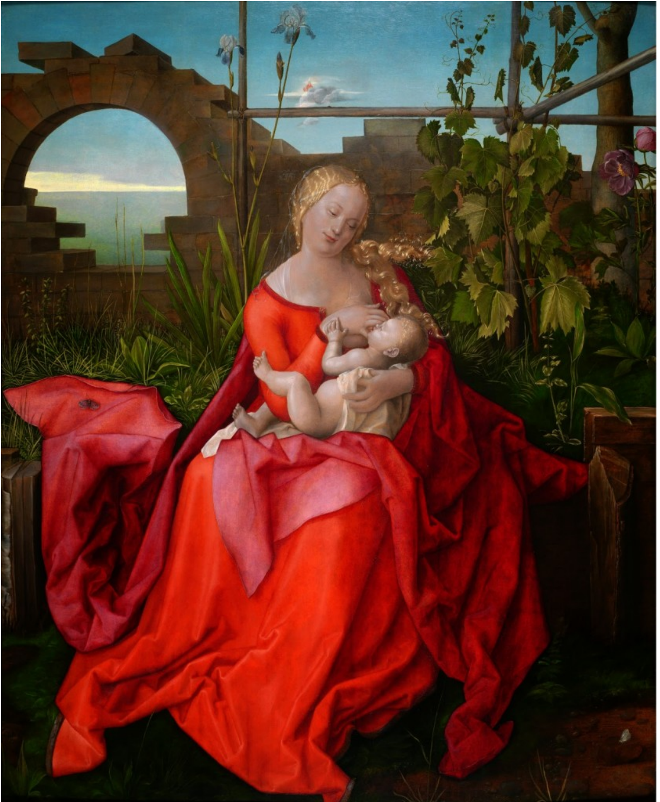
La Madonna con gli iris, dipinto di Albrecht Dürer (1471-1528) presso la National Gallery di Londra.

Il rosso cremisi è anche il colorante usato per l' Alchermes (o Alkermes ), un liquore sciropposo di color rosso rubino composto da alcol, zucchero, scorza di arancia, acqua di rose