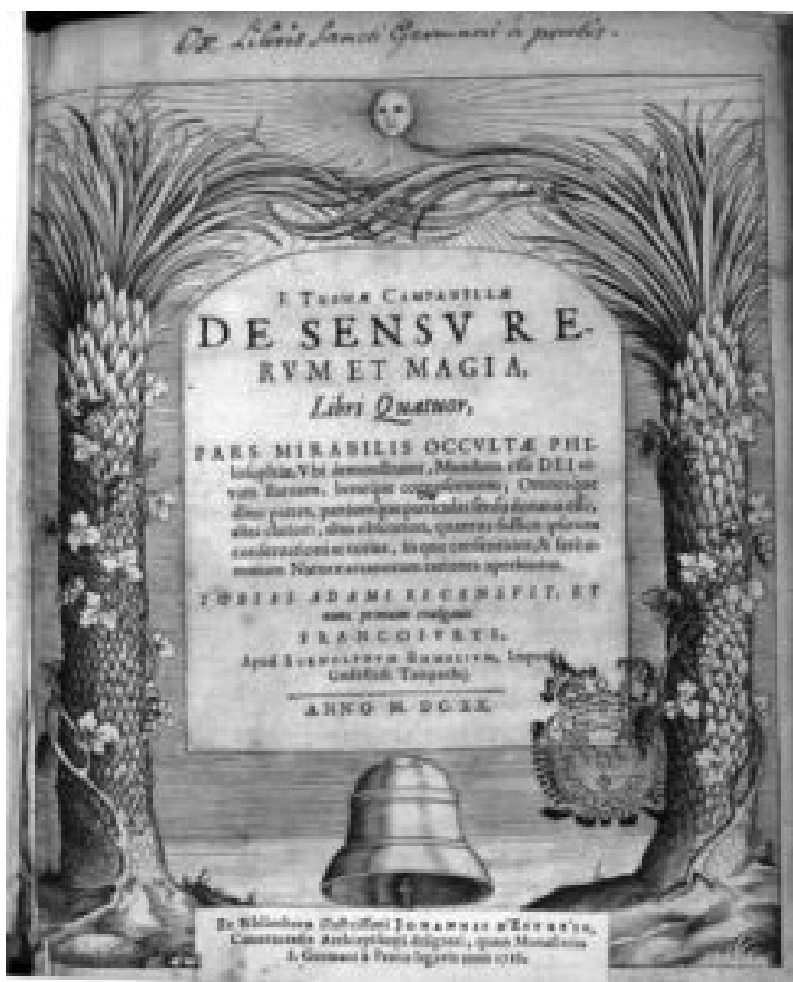
De Sensu Rerum et Magia, 1620 – frontespizio

«Or se gli animali, per consenso universale, hanno sentimento, e da niente il senso non nasce, è forza dire che sentano gli elementi, lor cause, e tutte, perché quel che ha l'uno all'altro convenire si mostrerà. Sente dunque il cielo e la terra e il mondo, e stan gli animali dentro a loro come i vermi dentro il ventre umano, che ignorano il senso dell'uomo, perché è sproporzionato alla loro conoscenza picciola.» [Ib., I, 1].