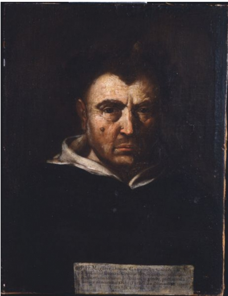
Francesco Cozza, Ritratto di Tommaso Campanella, Collezione Camillo Caetani, Sermoneta (Latina)

Di Tommaso Campanella si è tanto narrato: si è detto che questo visionario frate domenicano fosse demente e che la sua più importante opera, La Città del Sole , fosse una fantasticheria, ripresa dalle idee di Platone e dalla sua Politeia e bloccata in una sorta di atemporalità. Tuttavia, la vita di questo singolare frate, che ben aveva inteso le leggi degli equilibri naturali, appare sorretta da una eccezionale forza di volontà e da una inesauribile lotta contro la Chiesa per la sopravvivenza di due idee: libertà e sapienza.