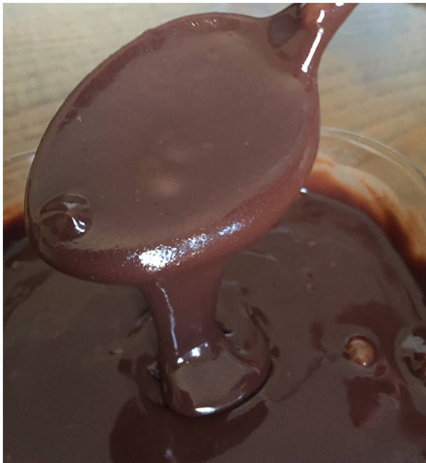
Sanguinaccio “senza sangue” (foto asciacatascia)

Nell'800 era solito conservare il sanguinaccio «dinto a lle stentina de puorco» (Cavalcanti, 1844), avendo premura di non riempirli troppo, rischiando così la rottura. Questo insaccato dolce era poi immerso in acqua calda e lasciato bollire pochi minuti, il tempo necessario a far cuocere l'intestino e, una volta pronto, si tamponava con stracci per asciugarlo e infine conservato. Poco prima di essere mangiato lo si poneva su carta unta di nzogna e si riscaldava per ravvivarne il gusto (Cavalcanti, 1844).