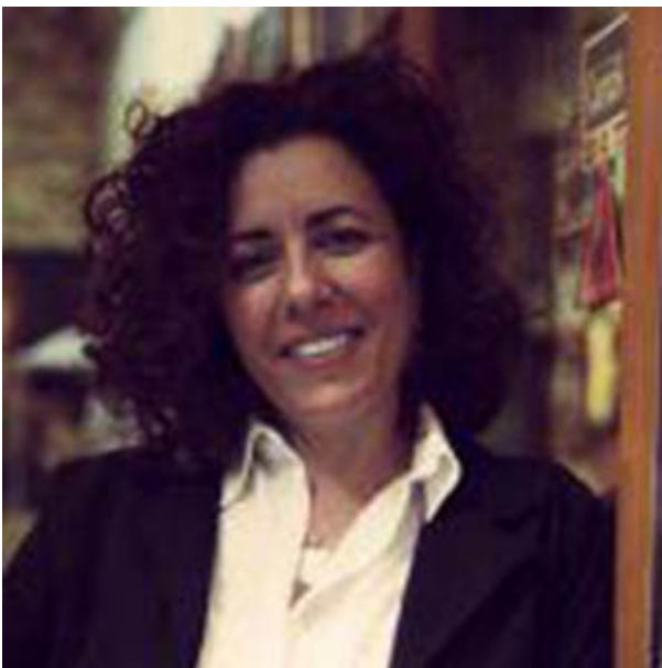
Consulente libraria Libreria Neapolis