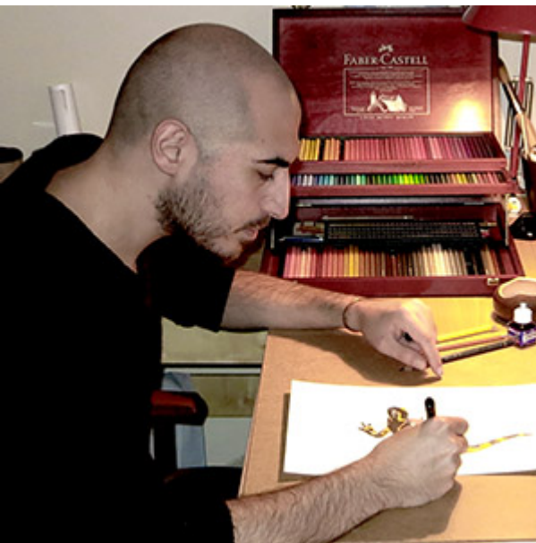
Naturalista – illustratore scientifico