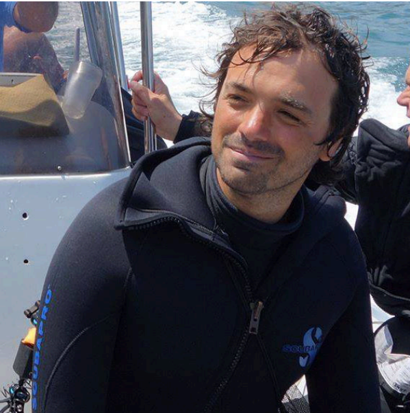
Naturalista – fotografo subacqueo