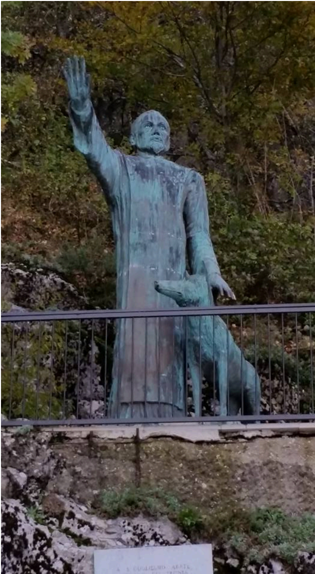
San Guglielmo e il lupo. Santuario di Montevergine.

In provincia di Avellino, dai racconti di molti anziani che hanno trascorso la loro intera esistenza in questi luoghi, i lupi emettevano liberamente i loro ululati lasciando che tutti gli abitanti dei paesi e della città li udissero. Era possibile, infatti, anche in strade del centro di Avellino, fino agli anni '30, ascoltare i loro ululati e, talvolta, avere degli incontri molto ravvicinati con esemplari di lupi che percorrevano queste terre, non ancora invase e devastate dalla speculazione edilizia degli anni '60 e, soprattutto, degli anni '80.