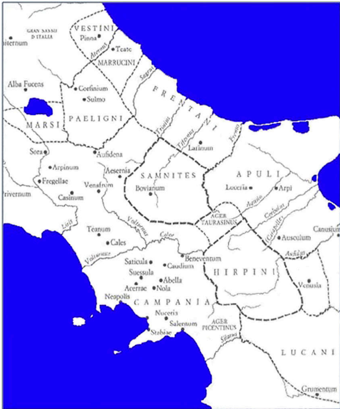
Aree occupate dai Sanniti e dalle popolazioni confinanti [Salmon, 1995].

In particolare, il Ver Sacrum sabello fu descritto minuziosamente da Strabone e da altri autori. Per vincere una battaglia, allontanare un pericolo o porre fine a una calamità naturale quale una carestia o un'epidemia, i Sabelli sacrificavano a Mamerte (il Dio Marte presso gli Osci) tutto ciò che fosse nato la primavera successiva. Si sacrificavano agli Dei sempre i prodotti più belli della terra e quanto