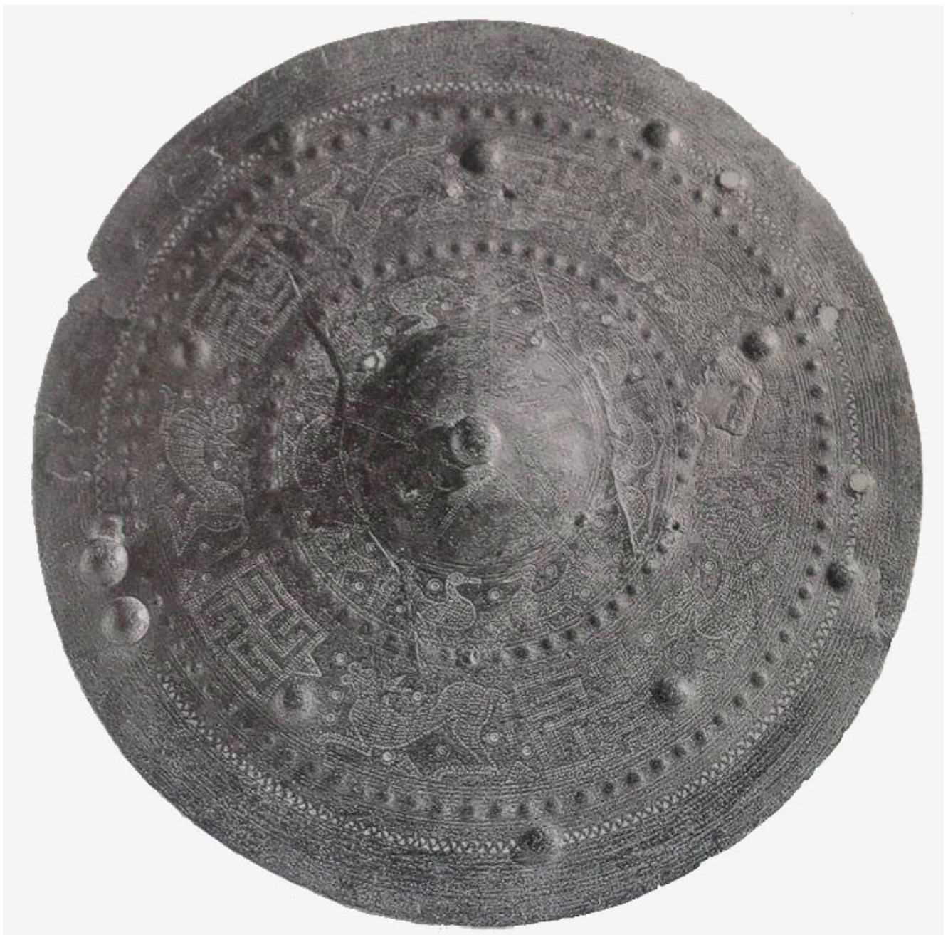
Kardiophylax appartenente a un guerriero sannita. Sono

potesse risultare gradito a delle divinità. Questa pratica riguardava anche i bambini che, tuttavia, non venivano letteralmente immolati, ma lasciati crescere come sacrati, ovvero consacrati al Dio e destinati, una volta divenuti adulti, a lasciare la loro tribù e cercare nuovi boschi e pascoli sotto la guida di un animale sacro alla divinità. L'animale-guida era, per queste tribù, uno tra i seguenti: un toro, un lupo, un picchio, un orso, un cinghiale (o, forse, anche un cervo) e il gruppo poteva stabilirsi solo nel luogo indicato dall'animale. Non si sa se si facesse ricorso a un animale reale, oppure se gli abitanti marciassero sotto un vessillo sul quale era raffigurato l'animale totemico.