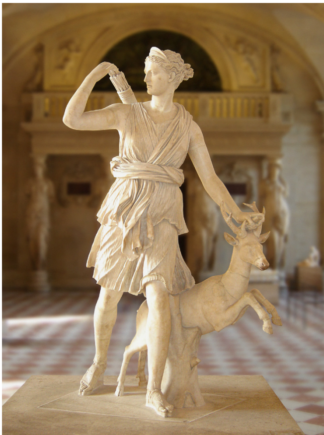
Statua di Diana con un cervo. Copia romana di originale ellenico. Parigi, Museo del Louvre.

La cerva dalle corna d'oro, di cui parla Pindaro nelle Olimpiche , era un animale sacro ad Artemide: la Dea ne aveva quattro attaccate alla sua quadriga. La terza fatica di Eracle fu la cattura della cerva Cerinea.