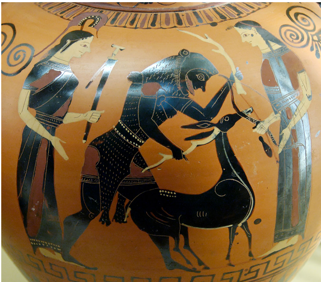
Eracle e la cerva di Cerinea (540-530 a.C. – anfora ritrovata a Vulci).

cerva bianca fuggì spaventata nel campo nemico, ma qui fu catturata e sacrificata a Latona. Nella leggenda si cela un evidente rito di evocatio , in virtù del quale i Romani cooptavano nel loro pantheon una divinità tutelare della città vinta. A Capua è presente, infatti, il santuario di Diana Tifatina, alle pendici del monte Tifata.