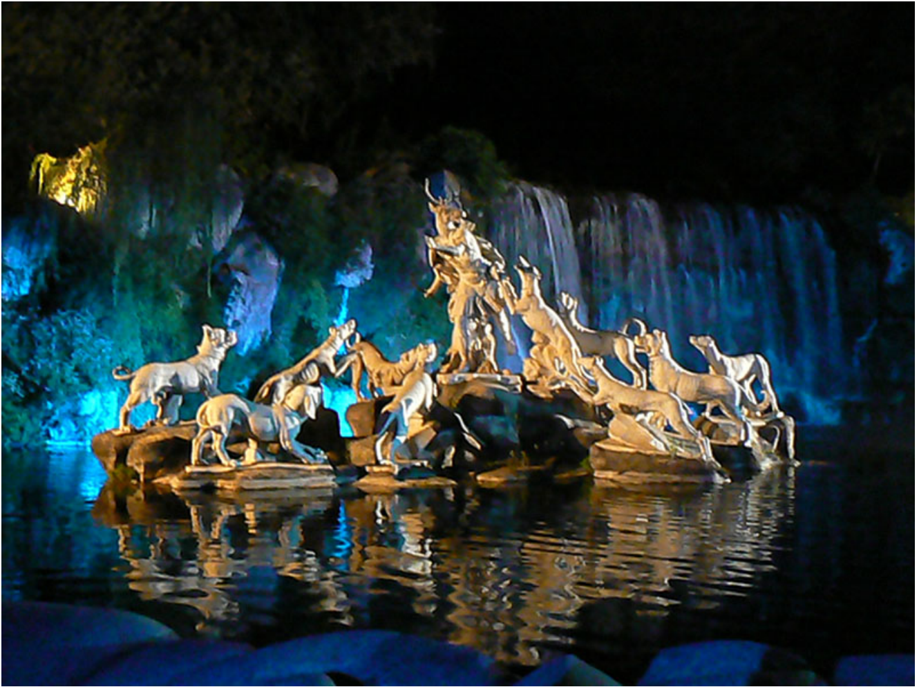
Scultura di Atteone e i suoi cani nella Reggia di Caserta.

Nelle antiche popolazioni italiche, il cervo aveva, con ogni probabilità, anche funzione totemica, in quanto, secondo lo storico Salmon (1995), avrebbe guidato le migrazioni avvenute, durante il rito del Ver Sacrum , di alcune popolazioni che si stabilirono nell'attuale Molise. La prova deriverebbe, secondo lo storico Rix (1955), dall'etimologia del nome dei Frentani, che verrebbe, a sua volta, dalla parola illirica che significa 'cervo'. È bene tenere a mente che Salmon giudica poco probabile questa ipotesi, ma esamina un'altra evidenza: nelle popolazioni sabelliche esisteva infatti il gentilicium osco Cervidius – a cui abbiamo accennato in precedenza – che fa certamente supporre che il cervo fosse, per loro, un animale guida.