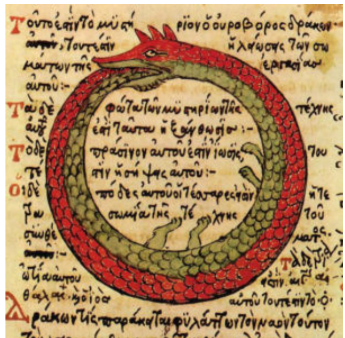
Uroboro (da Theodoros Pelecanos, Synosius , 1478).

Il serpente è connesso con la morte e con il mondo infernale per le sue abitudini sotterranee; però può anche avere una funzione positiva associata alla vita o alla resurrezione, al cambiamento benefico. Occorre considerare, infatti, la sua capacità di rigenerazione in seguito alla muta. L'uroboros, il "serpente che si morde la coda", simbolo del tempo ciclico e dell'eterno ritorno, è infatti legato, nella simbologia alchemica, all'idea di purificazione delle sostanze, all'idea di ascesi, di passaggio a un dominio superiore, che apparteneva certamente all'apparato simbolico dell'Ecate celeste.