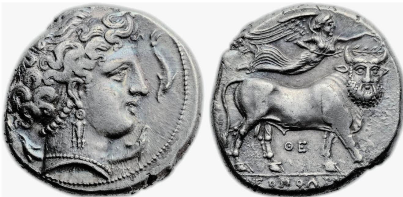
Moneta napoletana raffigurante Partenope e sul verso Ebone (ca. 300 a.C.)

Anche Ebone, nonostante la folta barba, potrebbe identificarsi come dio della gioventù e, con molta cautela, si potrebbe ipotizzare che il nome di Ebone sia il corrispettivo maschile di Ebe, dea della giovinezza, spesso associata a Dioniso. In effetti, dal nome della dea deriva il termine "efebo" che traccia un collegamento con la succitata pratica greca dell'efebia.