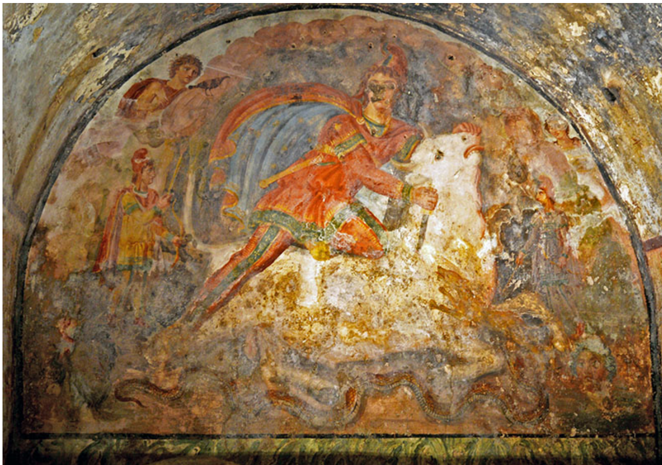
Mitreo di Santa Maria Capua Vetere

riconoscersi anche nel Sole, infatti il toro è associato a Mithra, divinità solare di origine iranica, il cui culto prevede che ogni 25 dicembre si celebri la rinascita del Sole ( Natalis Solis ) proprio sacrificando un toro.