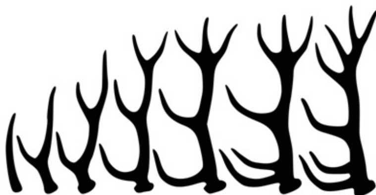
Diversa conformazione dei palchi a seconda dall'età del cervo.

le dimensioni massime entro quattro mesi, sempre rivestiti di velluto. Anno dopo anno, il volume, il peso e il numero delle punte aumentano. La credenza popolare che sostiene che si possa capire l'età di un maschio contando il numero delle punte e considerando un anno per ogni punta non sempre si dimostra corretta (ma in moltissimi casi è così) e per una stima più accurata dell'età di un cervide si deve osservare la dentatura.