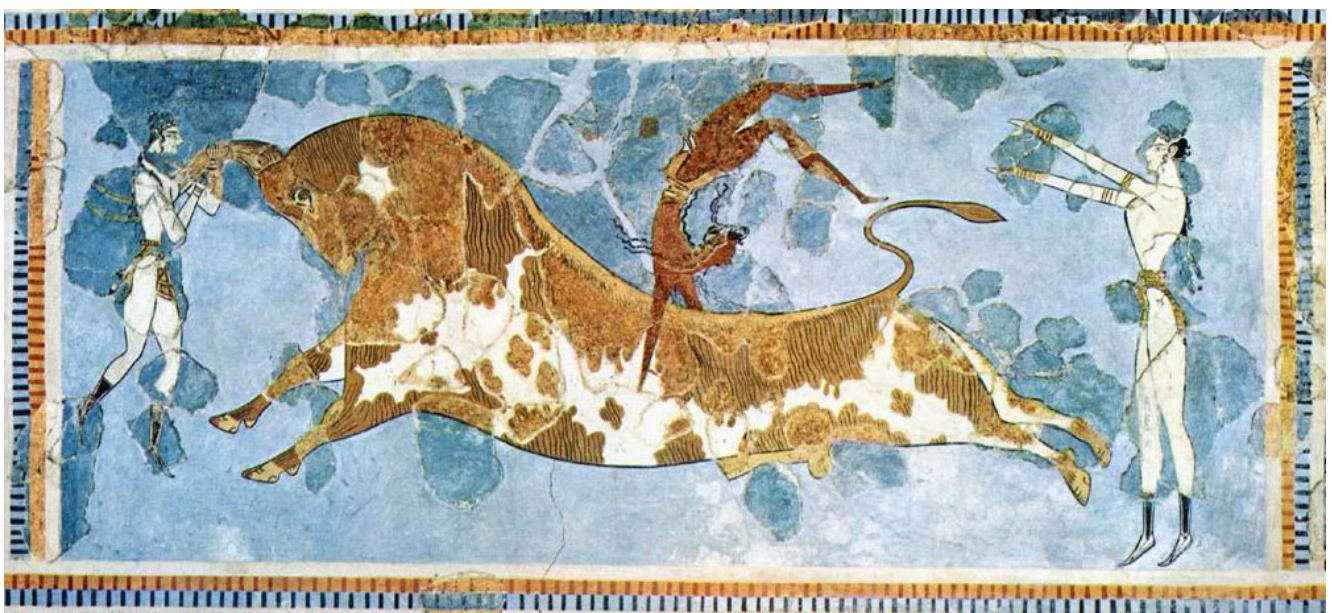
Taurocatapsia (Grande Palazzo, Cnosso, Creta)

Sempre a Creta, attorno alla figura del toro gravita uno sport spettacolare definito taurocatapsia: una sorta di danza acrobatica ricca di capriole eseguite sul dorso di un toro. I giovani cretesi si esibivano nelle arene minoiche in prove di destrezza e abilità fisica misurandosi contro l'indomita bestia. Questa pratica, esercitata nel 3000-1500 a.C. era probabilmente un rituale per omaggiare il possente animale. Ben diversa è la tauromachia, la lotta uomo-toro, di cui si parlerà in altra sede. È bene, però, iniziare a precisare che questo tipo di lotta non è circoscritto alla sola Grecia antica: non è da escludere che la corrida, simbolo nazionale spagnolo, possa essere legata alla tauromachia ellenica. È anche plausibile che questi spettacoli non fossero semplici sport popolari ma un antico retaggio del culto neolitico della Dea Madre, legato al periodo della cultura matrifocale, praticato sia nella penisola iberica che nella regione mediterranea. Del resto, già Sinclair Hood, in un libro uscito in edizione originale nel 1971, collegava la lotta uomo-toro a dei rituali della fertilità, per la nota valenza del toro in quell'ambito.