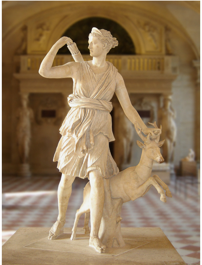
Statua di Diana con un cervo. Copia romana di originale ellenico. Parigi, Museo del Louvre.

La cerva dalle corna d'oro, di cui parla Pindaro nelle Olimpiche , era un animale sacro ad Artemide: la Dea ne aveva quattro attaccate alla sua quadriga. La terza fatica di Eracle fu la cattura della cerva Cerinea.