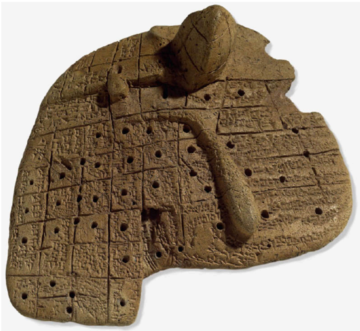
Modello anatomico babilonese del fegato di pecora (XIX sec. a.C.)

marginale. La divisione in sedici sezioni corrisponderebbe alla divisione del cielo riportata dalle fonti: tracciate due linee ideali in senso nord-sud ed est-ovest, si ottengono quattro quadranti, ciascuno dei quali è a sua volta diviso in quattro sezioni; ognuna di esse è sede di divinità, quelle a oriente sono considerate favorevoli, mentre quelle a occidente sono considerate sfavorevoli. Nonostante ciò, non è possibile stabilire una corrispondenza precisa tra le divinità delle sedici sedi della tradizione letteraria e quelle delle sedici sezioni periferiche del fegato di Piacenza.