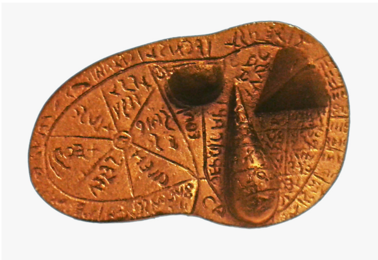
Fegato di Piacenza

punta e sempre con una gamba appoggiata su una roccia, sta esaminando un fegato all'interno di un gruppo di personaggi, uno dei quali è chiamato Tarchunus . È probabile che si tratti dell'iniziazione alla dottrina delle cose occulte di Tarconte, l'eroe eponimo di Tarquinia, da parte di Tagete, profeta al quale è legata la rivelazione della disciplina etrusca.