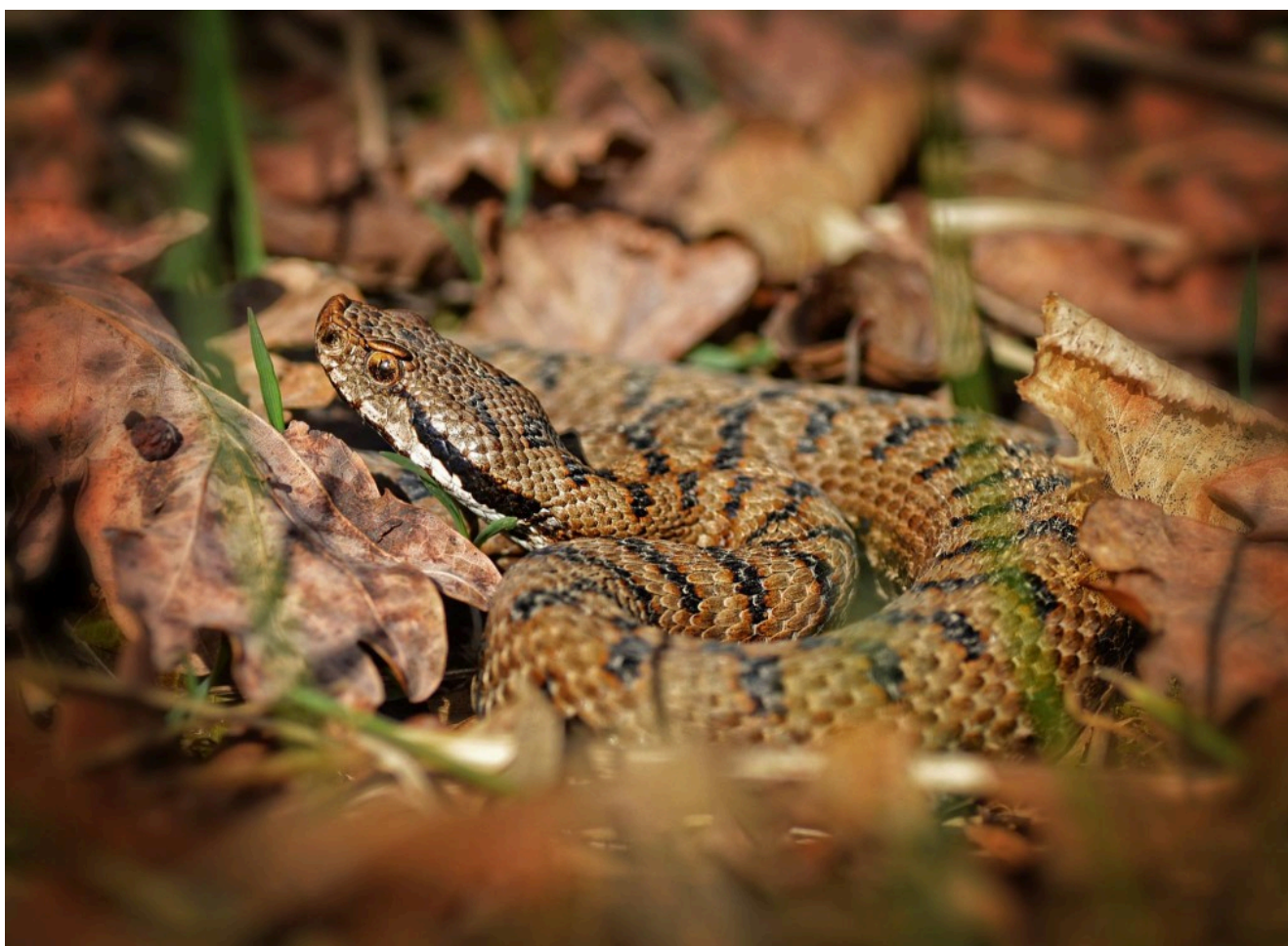
Vipera aspis